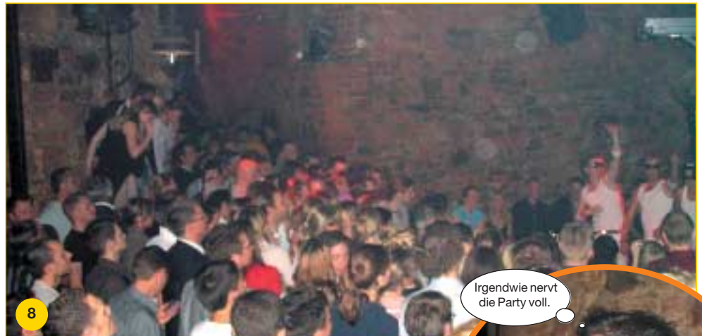
Die Party ist voll im Gange. Alle amüsieren sich, feiern und genießen das Showprogramm.