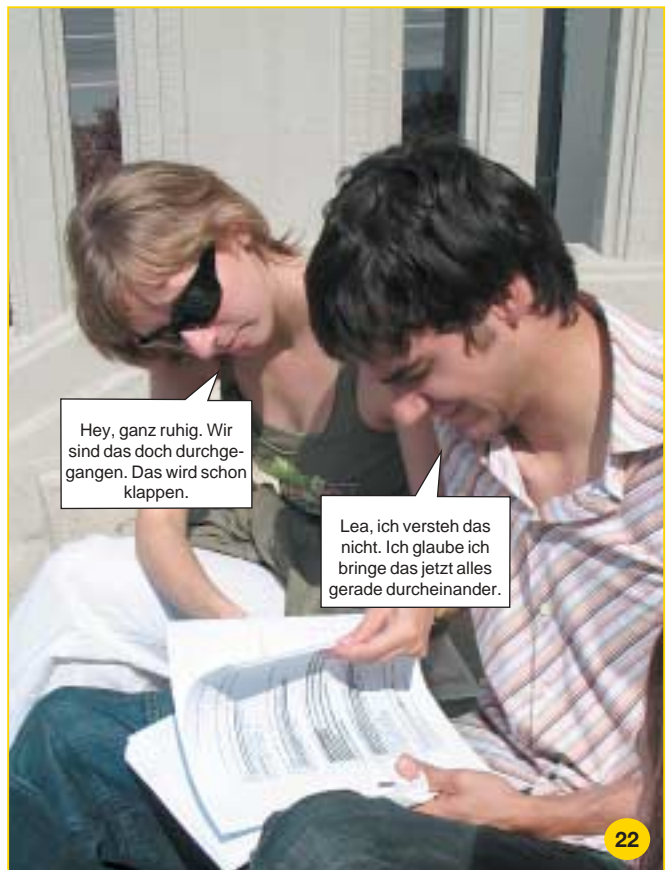
Auch beim Lernen verstehen sie sich hervorragend – obwohl sich beide sicher eine bessere Beschäftigung vorstellen könnten und auf andere Sachen Lust hätten.

Hey, ganz ruhig. Wir sind das doch durchgegangen. Das wird schon klappen.