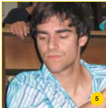
Er geht zur Uni, sitzt in der Vorlesung, doch die Sonne will nicht recht für ihn scheinen.