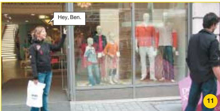
... scheint das Schicksal auf einmal eine völlig andere Wendung zu nehmen.