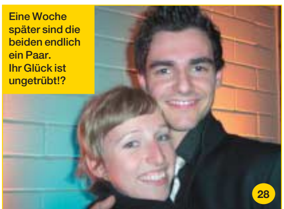
Die beiden verbringen den Rest des Nachmittags miteinander und den Abend und die nächsten Tage auch.