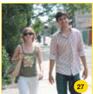
Nach dem Essen unterhalten sich die beiden noch lange. Sie lachen, auch darüber, dass beide die ersten Monate in Leipzig nicht in der richtigen Mensa essen waren.