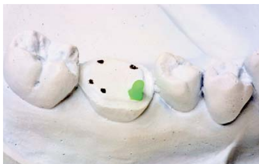
Abb. 1: Höckerpositionen und der erste Höckerkegel.

Wir beginnen zunächst, den mesiobukkalen Höckerkegel bis zur vollen Höhe aufzuwachsen (Abb. 1). Im weiteren Verlauf bauen wir zuerst die bukkalen Höckerspitzen auf, bis die notwendige Höhe erreicht ist. Dabei ist darauf zu achten, dass die Spitze selbst gerade außer Kontakt sein muss: die Kontaktpunkte zum Gegenbiss liegen dann rund um die Höckerspitze verteilt (Abb. 2). Mit der Okklufolie lässt sich leicht überprüfen, ob Kontakt besteht oder nicht: die nur 8 \mu starke Folie sollte sich leicht ziehen lassen, wenn der Artikulator geschlossen ist. Gleichzeitig