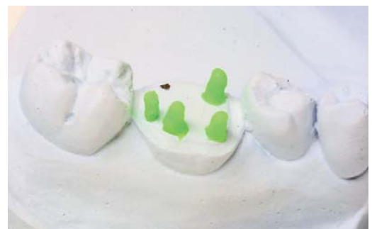
Abb. 2: Die Höckerspitzen werden nacheinander aufgewachst.

Im weiteren Verlauf bauen wir zunächst die äußeren Kronenflächen auf: bukkal werden die Grate aufgetragen, die die Wölbung des Zahnes vervollständigen. Dabei kontrollieren wir immer, ob sich die