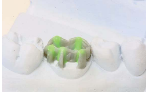
Abb. 4: Von bukkal lässt sich die Höhe schon kontrollieren.

Kronenwölbung harmonisch in die Zahnreihe einfügt. Ebenso verfahren wir mit den lingualen Flächen der Höcker. Umlaufend werden nun die bukkalen Höckerflächen aufgefüllt und geglättet, auf dieselbe Weise werden die Lingualflächen erstellt. Spätestens jetzt sollte man auch beginnen, die modellierten Flächen zusätzlich mit dem weichen Pinsel zu glätten, ohne dabei viel Druck auf die Modellation auszuüben, damit die Flächen sich hinterher leicht ausarbeiten lassen.