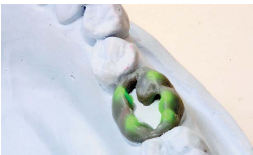
Abb. 6: Der erste Grat innerhalb der Kaufläche.

Die hier am Beispiel eines unteren Molaren vorgestellte Vorgehensweise zur Modellation einer Krone lässt sich auf jeden anderen Zahn übertragen: zuerst sollte man sich die Höckerspitzen markieren und dann umlaufend von mesiobukkal bis nach lingual diese bis zur notwendigen Höhe aufwachsen. Dann werden als Begrenzung der Kaufläche die umlaufenden Grate angeschwemmt und die äußeren Flächen der Krone komplettiert. Zuletzt werden die Grate der Kaufläche auch wieder umlaufend von bukkal nach lingual aufgetragen und zugeschwemmt. Mit Okklufolie sollte man dabei regelmäßig die Höhe kontrollieren. <<<