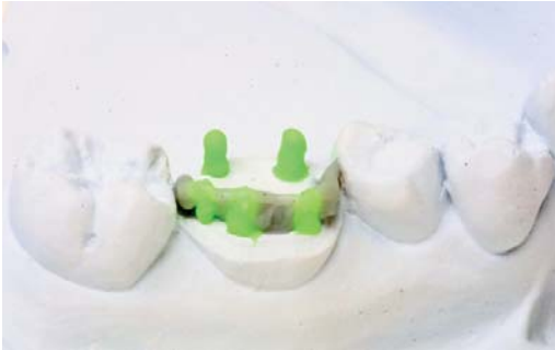
Abb. 3: Die Höckergrate verlaufen von einer Spitze zur nächsten.