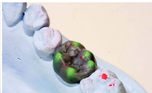
Abb. 7: Die fertige Modellation der Kaufläche.