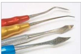
Modellierinstrumente für die Aufwachstechnik.

Zur Modellation einer Krone bzw. einer Kaufläche benötigt man verschiedene Instrumente und Materialien: