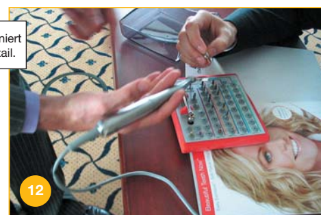
Deshalb geht er auch in den Nobel Biocare Workshop und fragt genauestens nach.