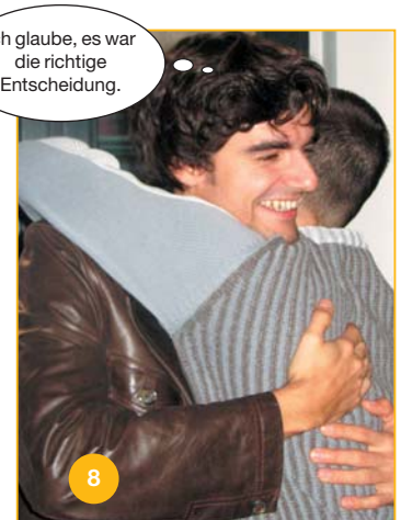
Nun scheint alles wieder gut zu sein ...