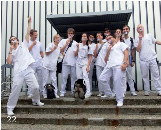
22 Studieren in Freiburg im Breisgau – Ein Erfahrungsbericht.