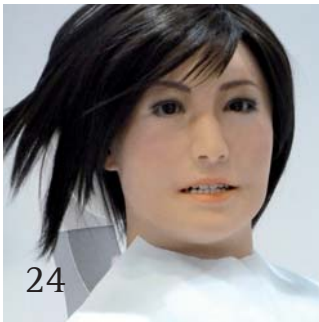
24 Die Roboterpatientin – Zukunft der Lehre?