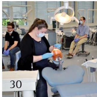
30 Nachbericht BuFaTa Berlin.