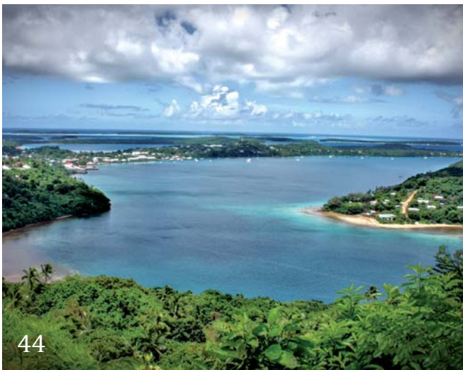
44 Arbeiten im Ausland – Famulaturbericht Tonga.