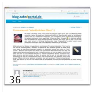
36 Ein Jahr zahnportal-Blog – Rück- und Ausblick.