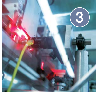
Abb. 1–3: Das Neueste vom Neuen: Die deutsche Dentalindustrie ist in vielerlei Hinsicht Technologie-Vorreiter durch hoch präzise Fertigung, penible Kontrolle und digitale Vernetzung.

guten Geräten einen ganzen Kariesstatus so schnell erstellen wie beim Durchgang mit dem Spiegel. Er kann dazu digital und patientenbezogen abgespeichert werden und die Entwicklung über längere Zeiträume hinweg darstellen. Nicht unterschätzen sollte man dabei, dass nichts für den Patienten anschaulicher ist als eine mit den entsprechenden Bildern dokumentierte Kariesdiagnose. Medizinisch gesehen können Fluoreszenzsysteme in letzter Konsequenz sogar eine minimalinvasive Kariesentfernung erleichtern.