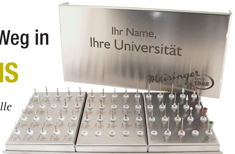
Abb. 1: Individueller Bohrerständer gefällig? Jetzt mit persönlicher Laserung für Studenten.

Hager & Meisinger ist der vertrauensvolle Ansprechpartner in allen Fragen rund ums rotierende Instrument