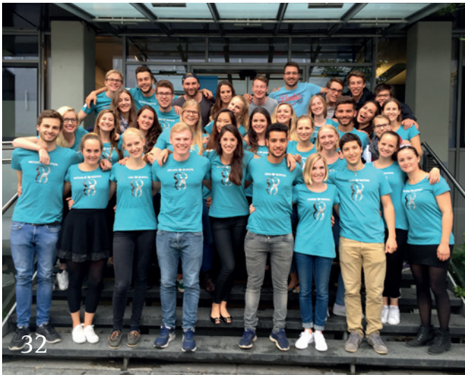
Die Sommer-BuFaTa in Erlangen.