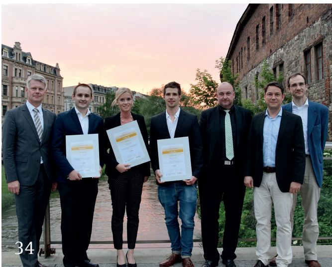
Young Scientists in Dentistry 2016 – Symposium in Halle (Saale).