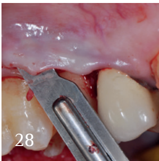
Parodontologie im Fokus.