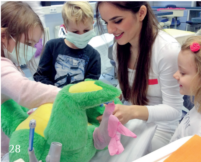
Die Frankfurter Teddy-Zahnklinik.