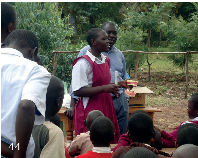
Nachbericht: Famulatur in Kenia.