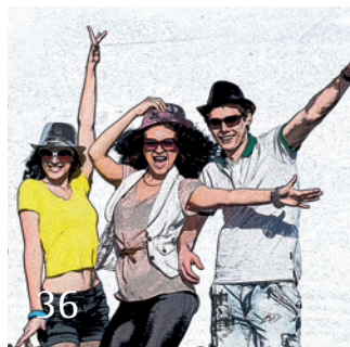
dentXperts-Club für Zahnmediziner.