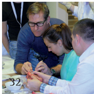
Mit der DGOI zum Implantologie-Experten werden.