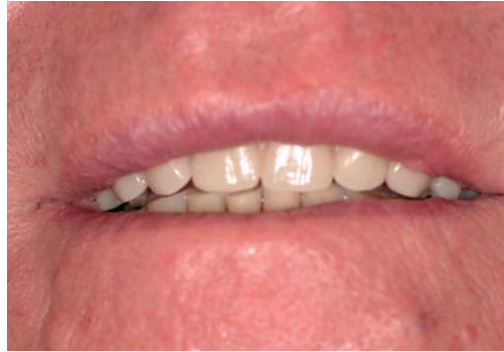
Abb. 6: Prothesen im Mund.