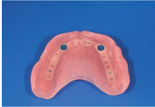
Abb. 3: Oberkieferprothese mit eingearbeitetem Locator.