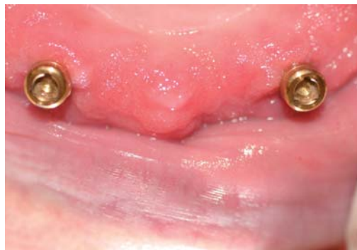
Abb. 7: Locator in situ.

Eine Woche nach dem Eingliedern erfolgt die erste Remontage, wobei die Bisslage überprüft wird. Mit Aluminiumwachs erfolgt eine Bissnahme. Die Handhabung der Prothesen wird erfragt, zu straffer oder zu lockerer Sitz kann durch Auswechseln der Matrizen behoben werden. Drei Retentionsstufen stehen für