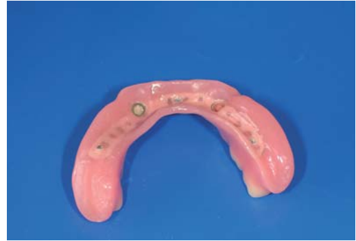
Abb. 4: Unterkieferprothese mit eingearbeitetem Locator.

ganz verzichtet, da diese irritierend auf die Muskulatur wirken und so die funktionelle Abformung stören.