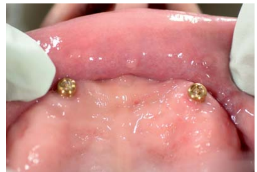
Abb. 2: Locator Oberkiefer in situ.