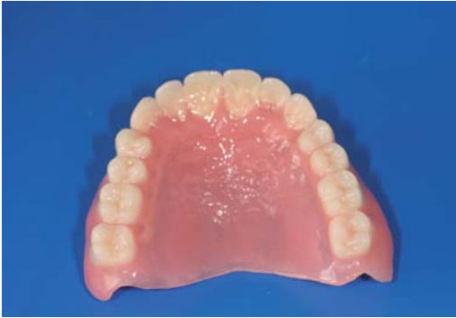
Abb. 5: Ansicht Oberkieferprothese.