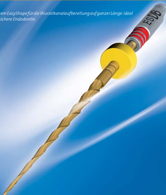
Abb. 2: Das Feilensystem EasyShape für die Wurzelkanalaufbereitung auf ganzer Länge: ideal für den Start in eine sichere Endodontie.