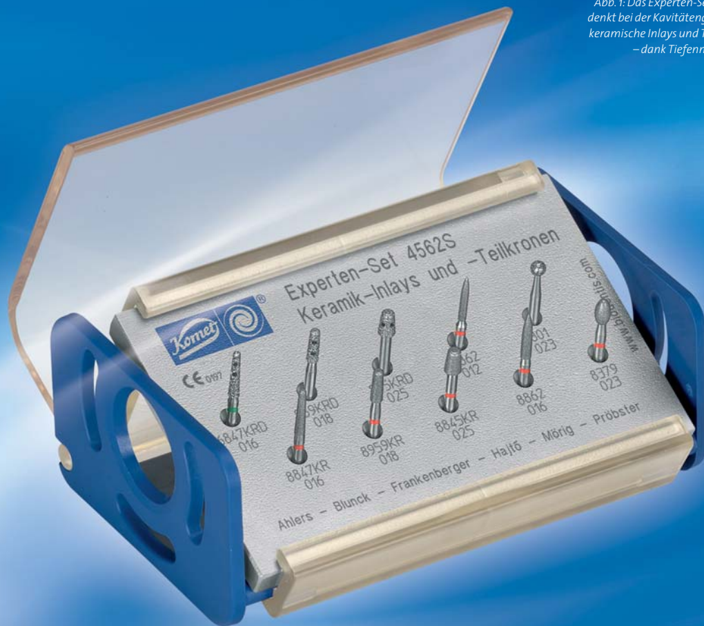
Abb. 1: Das Experten-Set 4562/4562S denkt bei der Kavitätengestaltung für keramische Inlays und Teilkronen mit – dank Tiefenmarkierungen.