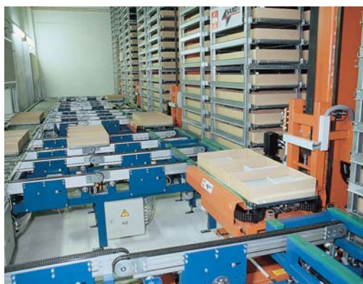
Abb. 4: Unter www.kometdental.de bei „Service“ einfach auf „Bestellung“ klicken: Ist der Auftrag online abgeschickt, können Sie sich regelmäßig binnen 48 Stunden auf ein Päckchen von KOMET freuen.

Wer KOMET-Produkte kauft, muss nicht den Umweg über den Dentalhandel gehen. Ihr Fachberater betreut Sie individuell mit viel Know-how und Feingefühl, damit sich Ihr neues Praxiskonzept und Ihre Bedürfnisse in den KOMET-Instrumenten widerspiegeln.