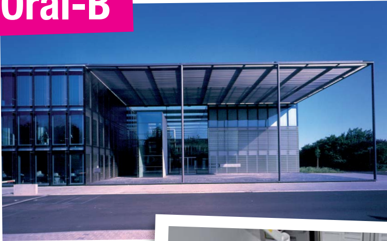
Abb. 1: Geballte wissenschaftliche Kompetenz unter einem Dach: das Oral Care Forschungs- und Entwicklungszentrum von P&G in Kronberg.