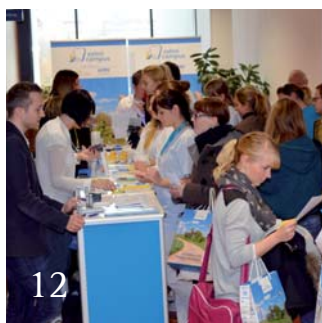
ZahniCampus Roadshow tourt an den Unis.