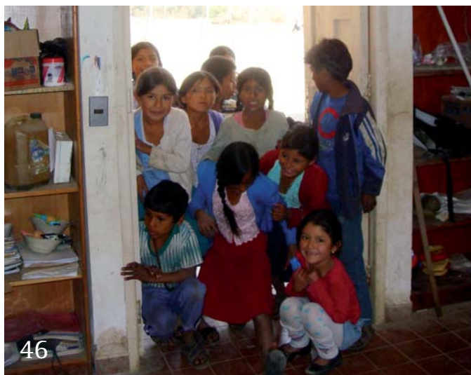
Eine Reise nach El Dorado – Teil 2.