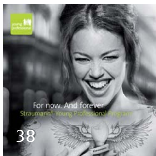
Young Professional Program von Straumann.