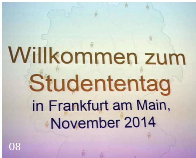
Das war der Studententag 2014 – ein Nachbericht.