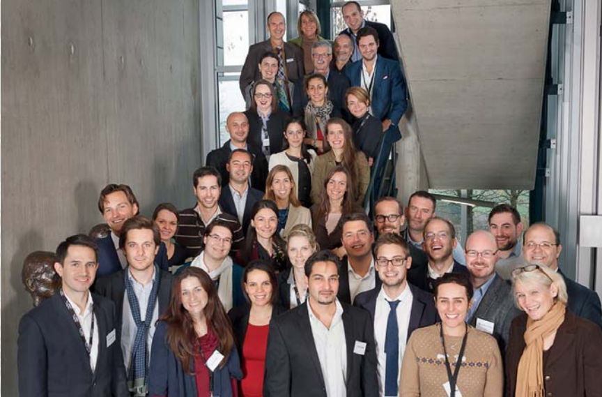
Die Teilnehmer sowie Jurymitglieder des Expertise Talent Awards 2013.