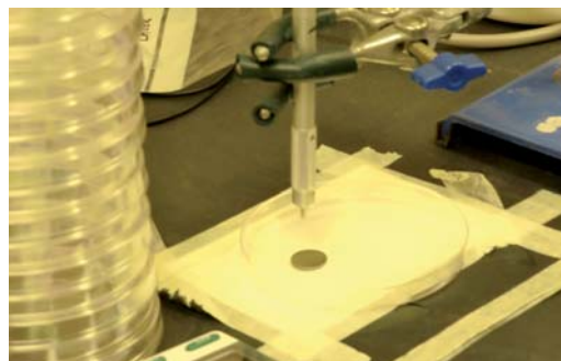
Einsatz eines Lasers (Photodynamische Therapie) zur Zerstörung von Biofilmen.

Für die Teilnahme bewerben dürfen sich junge Zahnärzte und Wissenschaftler europäischer Universitäten, deren akademischer Abschluss vor weniger als fünf Jahren erworben wurde. Die Bewerbung zur Teilnahme in einer der beiden Kategorien – wissenschaftliches Projekt oder klinischer Fall – erfolgt durch Einsenden einiger Informationen inklusive Kurzbeschreibung des beruflichen Werdegangs und Abstract zum geplanten Vortrag an 3M ESPE. In diesem Jahr ist der Einsendeschluss der 30. September 2015. Danach werden die Teilnehmer ausgewählt und zur