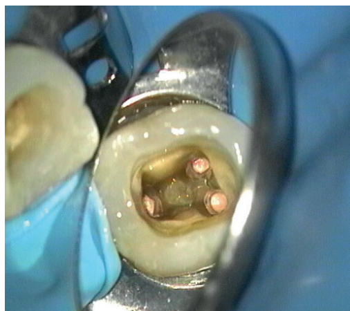
Abb. 2: Die Wurzelkanalfüllung erfolgte in warm-vertikaler Kondensationstechnik (nach Schilder).