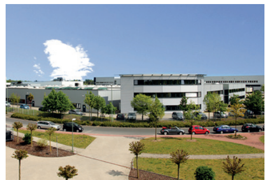
Abb. 3: Ob Produktionsrundgang oder Schulung – in unserer Firmenzentrale in Neuss sind Studenten immer herzlich willkommen.

Auch besteht bei uns die Möglichkeit, als Gruppe mal einen Blick hinter unsere Kulissen zu werfen und die Produktion zu besichtigen. Und dort gibt es für Stu-