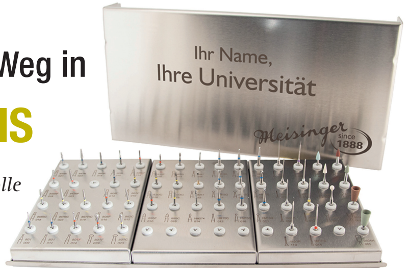
Abb. 1: Individueller Bohrerständer gefällig? Jetzt mit persönlicher Laserung für Studenten.

Hager & Meisinger ist der vertrauensvolle Ansprechpartner in allen Fragen rund ums rotierende Instrument